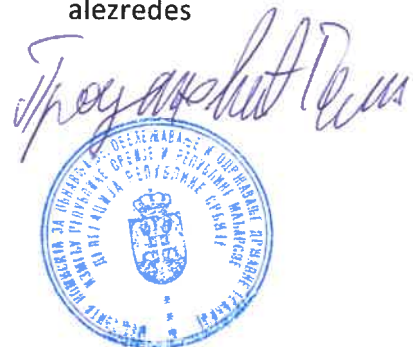
Goran Prodanović alezredes

A Vegyesbizottság szerb küldöttségének elnöke: